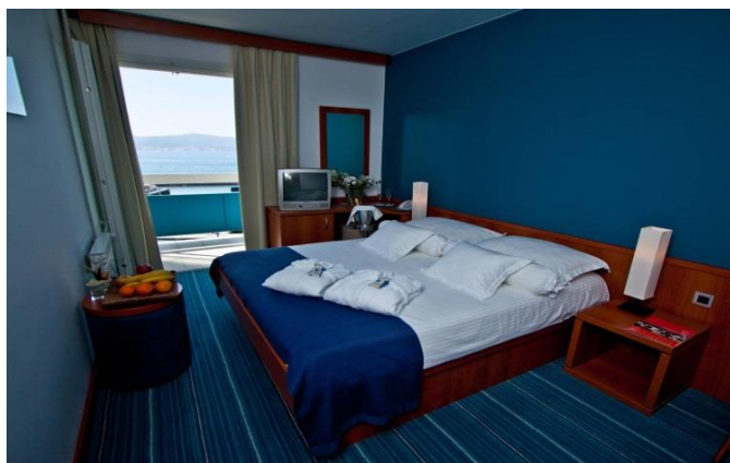
Cijene u KM po osobi /danu polupansion.