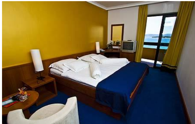
Cijene u KM po osobi /danu polupansion.