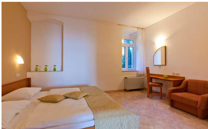
Cijene u KM po osobi, danu polupansion