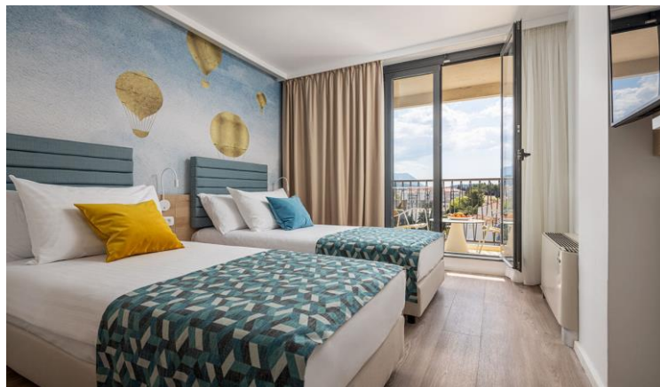
Cijene u KM po osobi / danu Popupansion