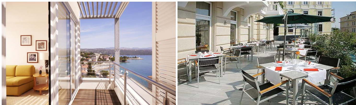
Cijene u KM po osobi/danu, noćenje sa doručkom