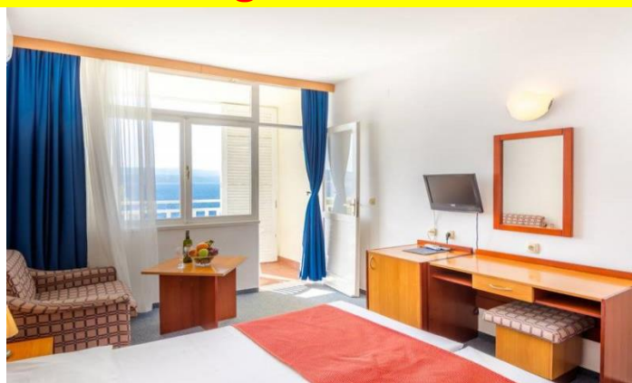
Cijene po sobi/danu u KM, usluga All inclusive light