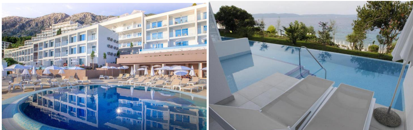
Cijene u KM po osobi/danu ALL INCLUSIVE